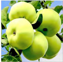
Oliwka Żółta Papierówka 2 szt